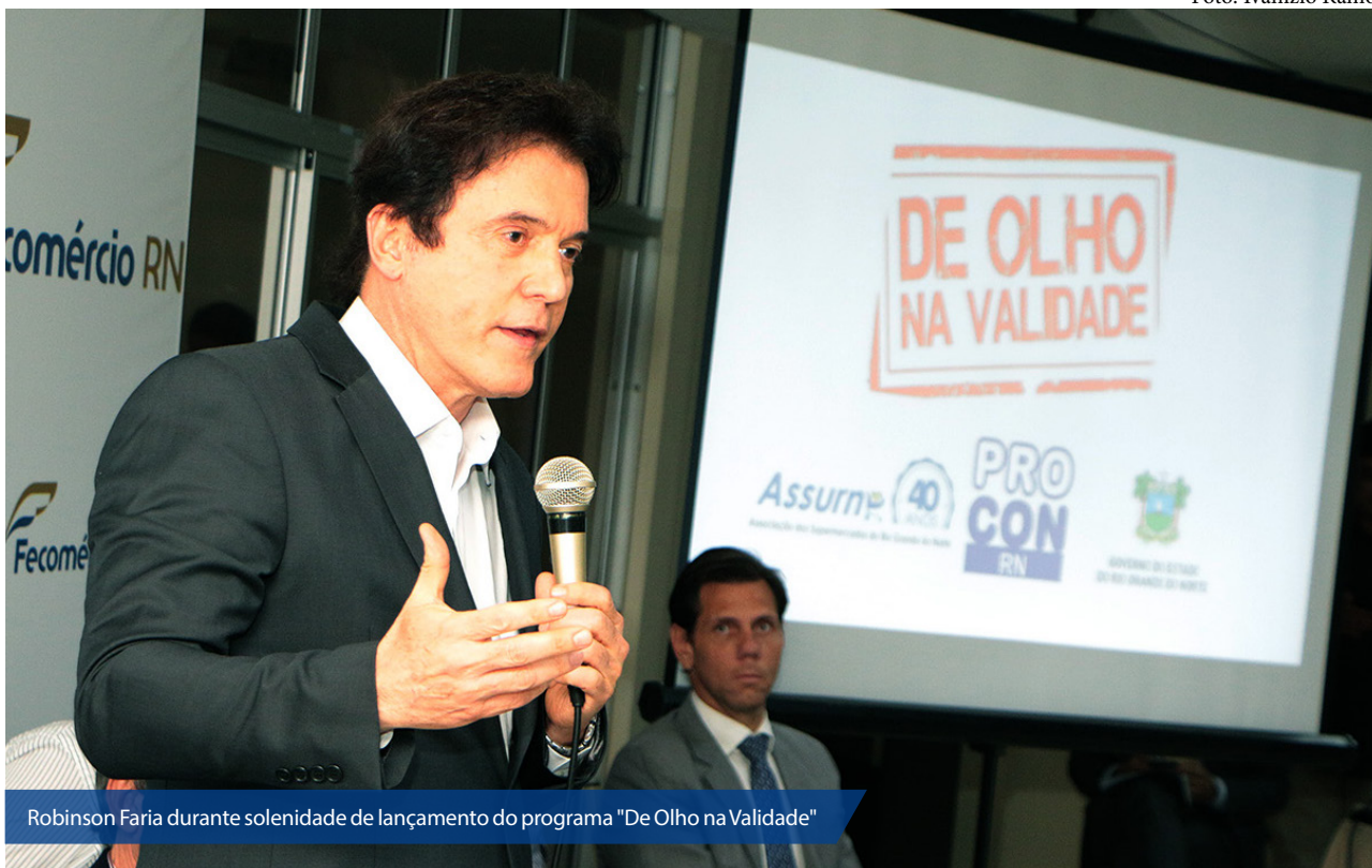
Robinson Faria durante solenidade de lançamento do programa "De Olho na Validade"

O Governo do Estado lançou, esta semana, a campanha “De Olho na Validade”. O projeto, fruto de parceria entre o Procon e a Associação dos Supermercados do RN (Assurn), estimula o consumidor a ficar mais atento às datas nos rótulos e penaliza o comércio que mantiver produtos vencidos em suas prateleiras.