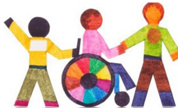
Atualmente, 1283 estudantes do município necessitam de acompanhamento específico

Em maio deste ano, o Núcleo Especializado de Tutelas Coletivas da DPE/RN abriu um procedimento preparatório para demanda coletiva para averiguar se a rede municipal de ensino garante ou não serviços de apoio pedagógico especializado para crianças e adolescentes com deficiência em conformidade com a legislação federal em vigor. A Defensoria Pública possui a função institucional de promover a defesa, em todos os graus de jurisdição, dos interesses dos grupos sociais considerados hipervulneráveis e, como tal, possui um Núcleo Especializado de Defesa das Pessoas com Deficiência, além de atuar em demandas coletivas através do Núcleo Especializado de Tutelas Coletivas.