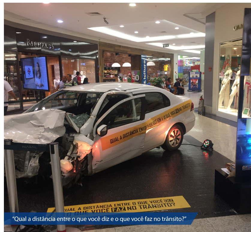
"Qual a distância entre o que você diz e o que você faz no trânsito?"

A aprovação expressiva da campanha reforça o objetivo do Governo do Estado e Detran de levá-la para todos os municípios do Estado. 99,2% dos entrevistados acreditam que a mídia para educação no trânsito deve ser contínua. E é isso que o Governo do Rio Grande do Norte vem fazendo. A atual campanha é a quarta desde 2014. Anteriormente, o Detran trabalhou os temas "Gentileza", "Motorista do Bem", "Trânsito Seguro" e agora a campanha #CurtoDirigirBem.