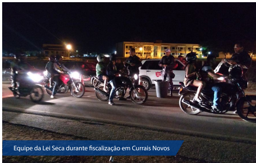
Equipe da Lei Seca durante fiscalização em Currais Novos

A equipe da Operação Lei Seca do Departamento Estadual de Trânsito do RN (Detran) divulgou o resultado de três dias consecutivos de fiscalizações realizadas nas cidades de Currais Novos e Caicó. As intervenções ocorreram durante três dias deste mês, resultando na abordagem e fiscalização de 1.698 condutores e veículos.